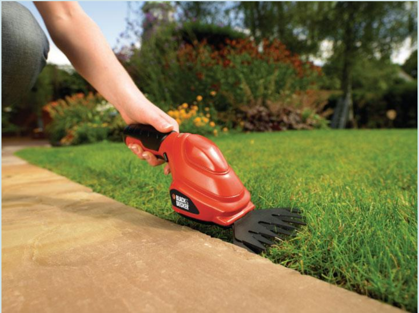
Кошење ивице травњака маказама