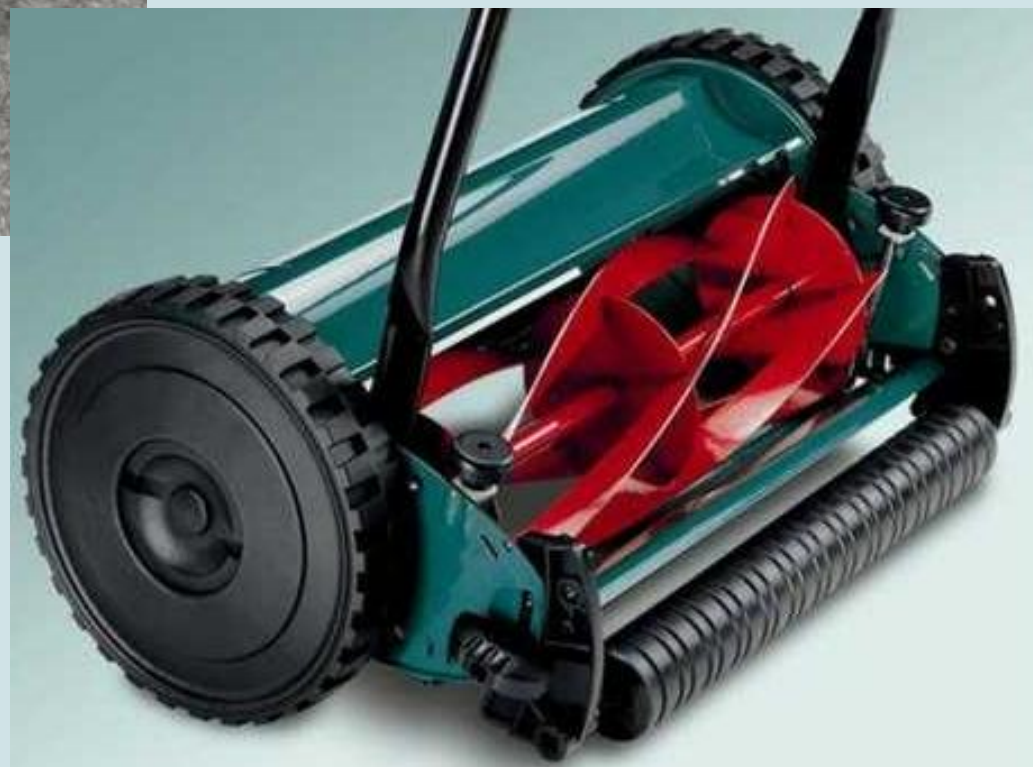
Ручна косачица – радни део