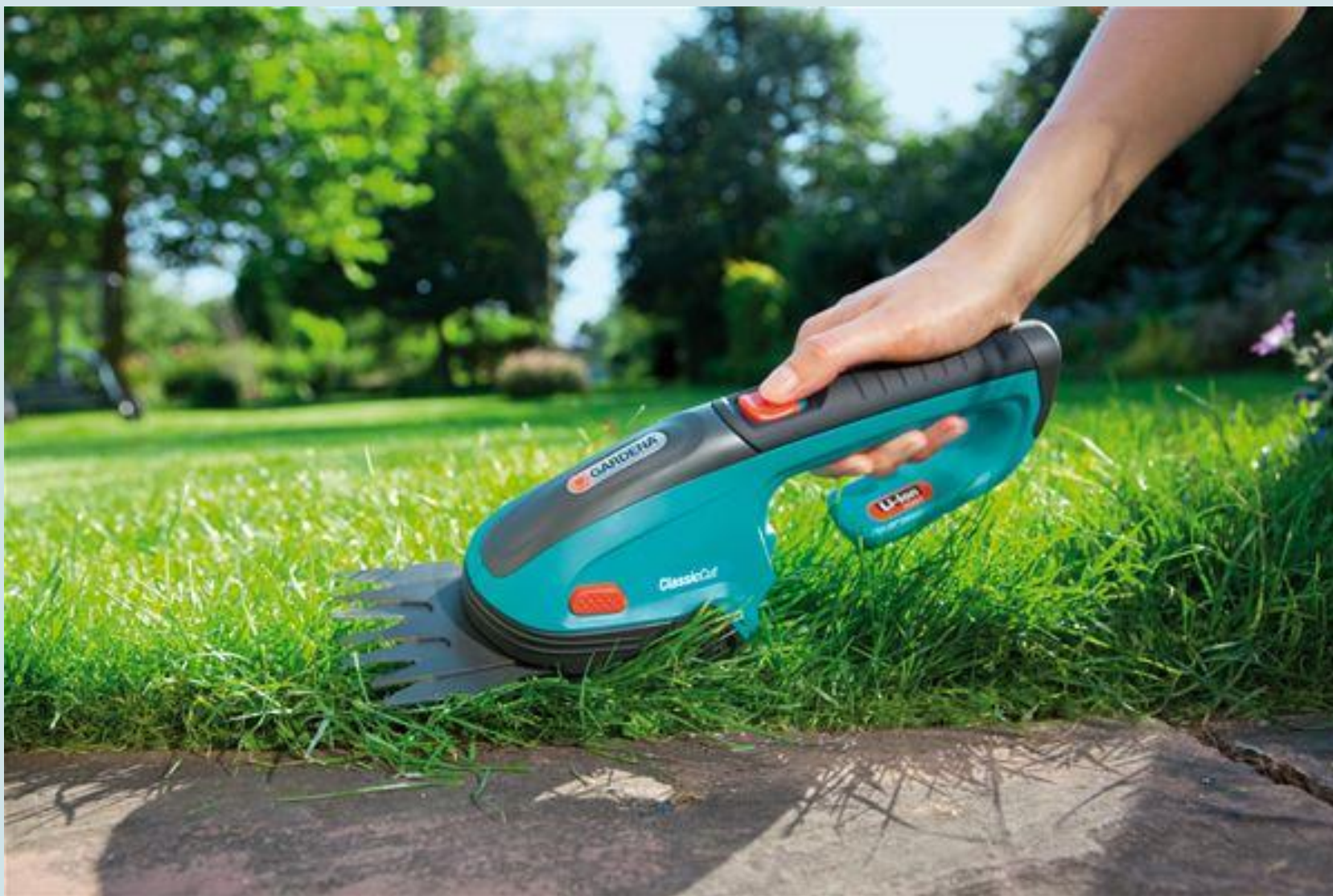
Кошење ивице травњака маказама