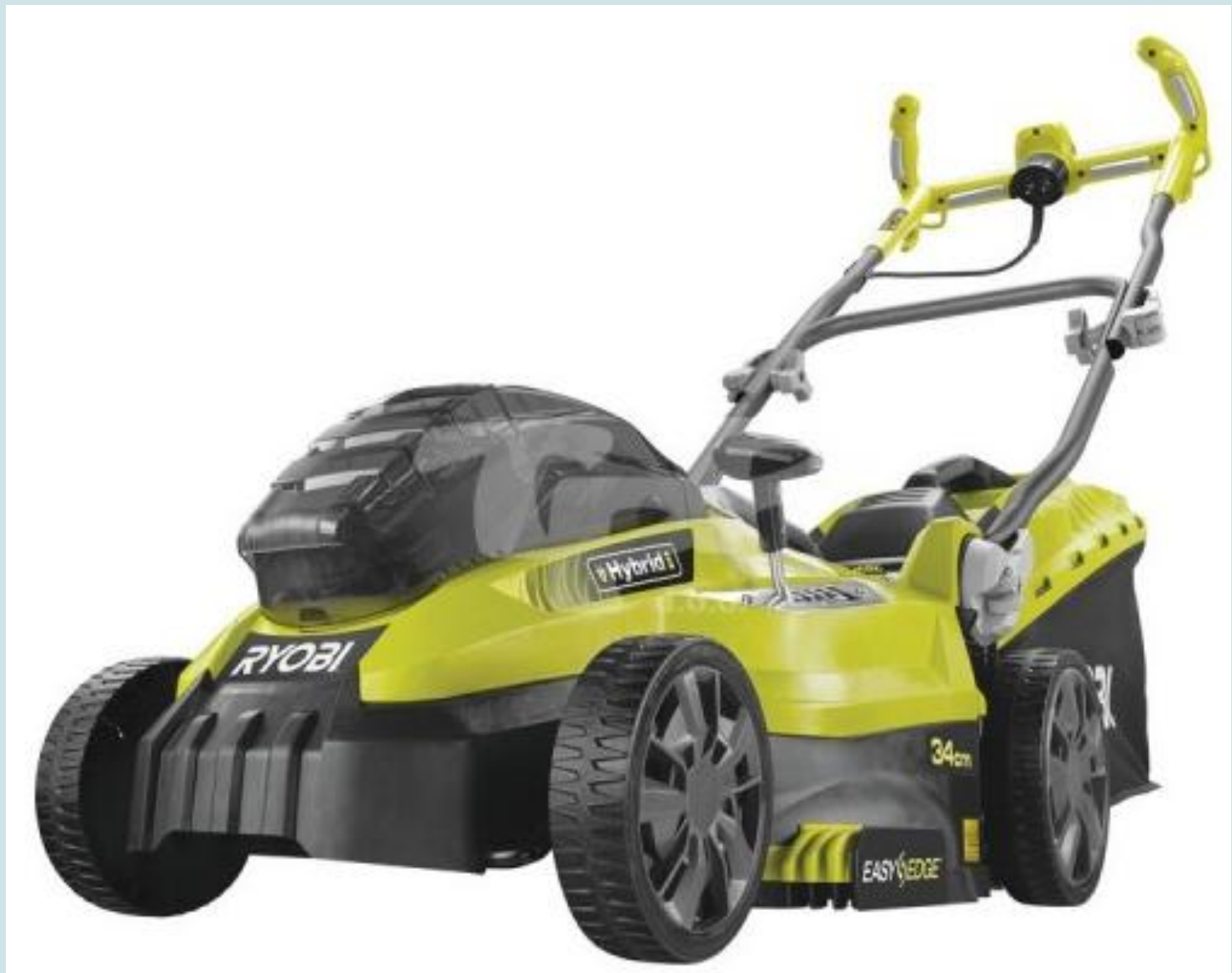
Хибридна моторна косачица (струја / батерије)