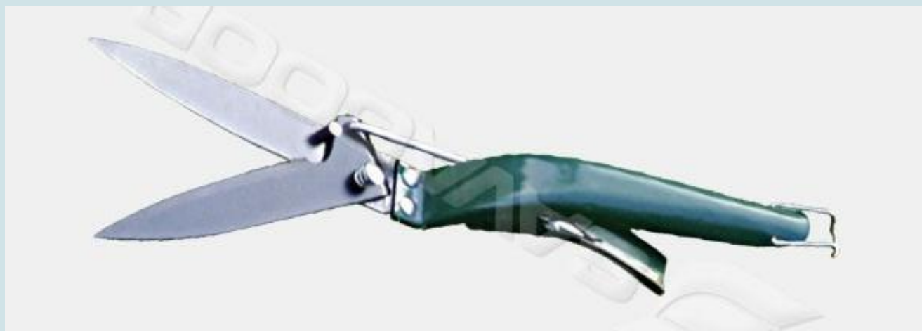
Маказе за траву