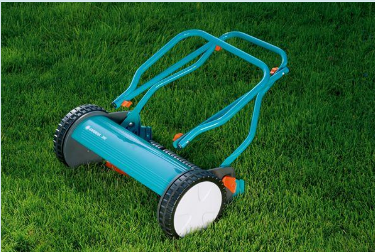
Ручна косачица - склопива