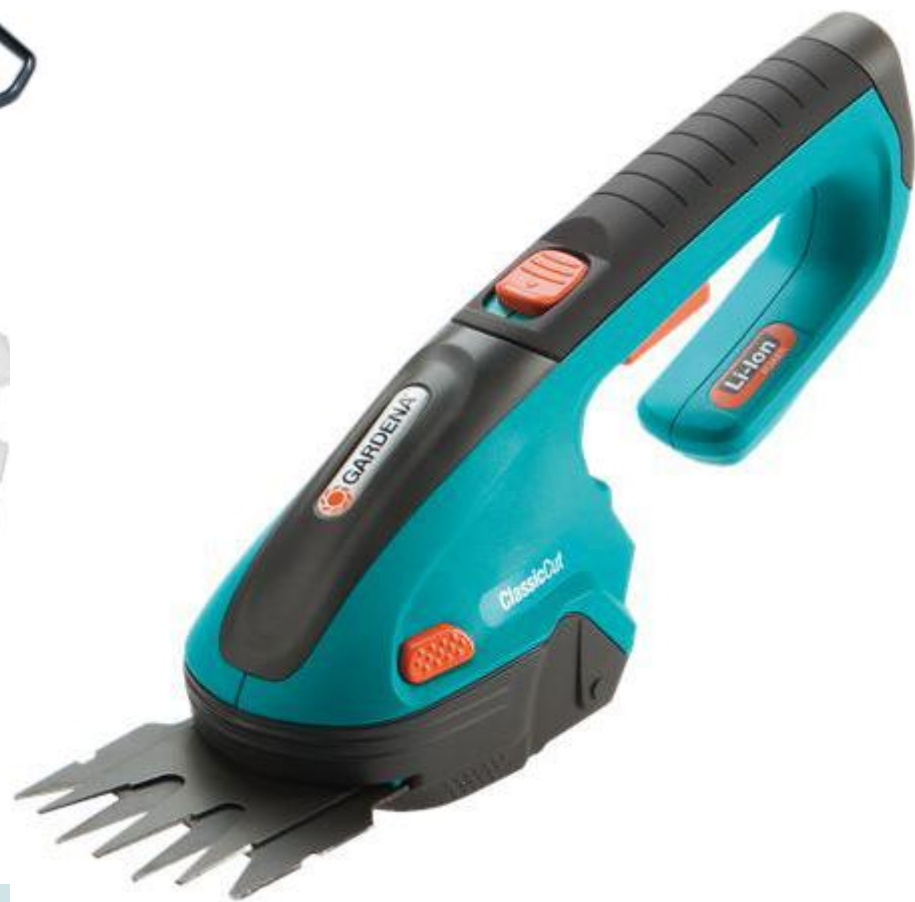
Маказе за траву (акумулаторске)